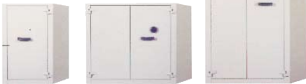
AF II est disponible en 3 volumes.

AF II est disponible en 3 volumes. Conçue pour apporter une capacité de stockage maximale, elle possède un espace intérieur entièrement modulable. Pour un accès total, les portes peuvent s'ouvrir jusqu'à 180°. AF II est conçue en tôle d'acier 20/10e, les portes sont à doubles parois d'une épaisseur de 65 mm. Quatre pènes cylindriques d'un diamètre de 20 mm assurent la condamnation de la porte.